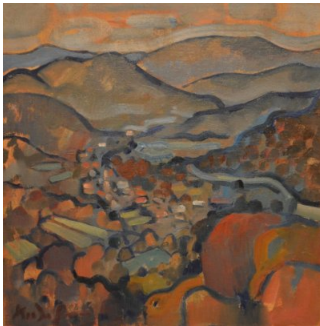
A hegyek ölelésében

A nagy példakép, Claude Monet után expresszív szénakazlakat fest Matacsifalván, Padócon talán április vége felé azokat a tündöklő tavaszi fényeket, amikre úgy várunk már a végeleáthatatlan telekben. És esti fényeket a parasztudvarokban, a szénatárolók között, amikor az utolsónak maradt kakas is jónak látja már, hogy az ólba a többiek után induljon.