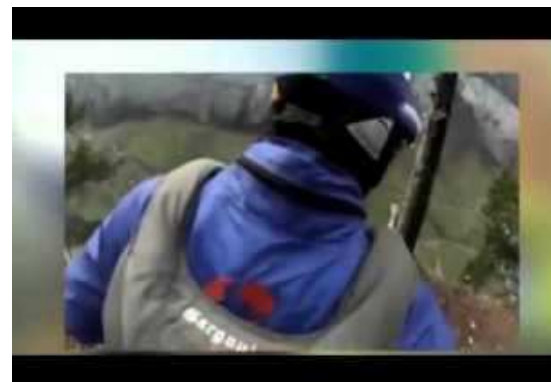
Halálos ugrása előtt fotózott az extrém sportoló (video)