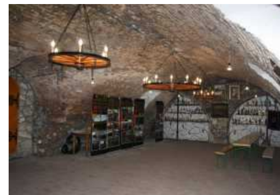
Ismét gazdagodott a Beregvidéki Múzeum