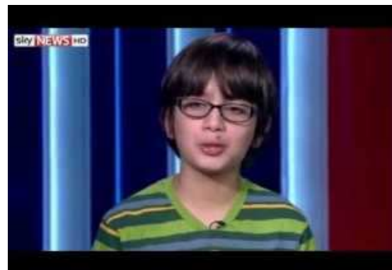
A brit oktatási miniszter nem okosabb, mint egy ötödikes (video)