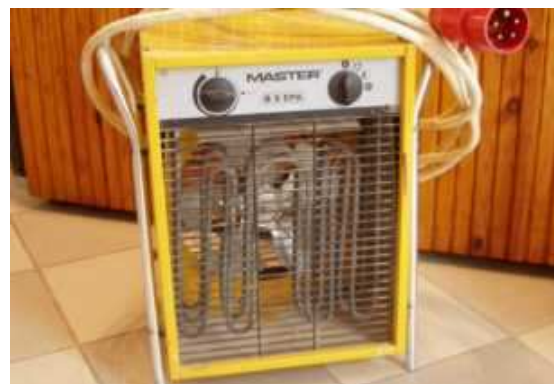
A palántanevelők fűtése