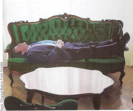
BIRKÁS ÁKOS: Fehér négyzet, 2009, olaj, vászon, 160x240 cm

A MODEM kiállításának címe egyfelől a hagyományosan erősen misztifikált műtermi munkára, azaz a mesterségbeli, „céhes” tradícióra utal, másfelől a festészet művelőjének általános szerepfelfogására kérdez rá. Mi iránt kell elköteleznie magát a festőnek? Van-e dolga még egyáltalán, vagy csak dolgai vannak? Birkás Ákos határozott fordula-