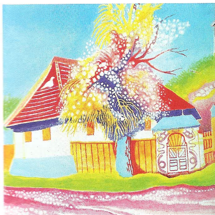
SOMOGYI GYŐZŐ: Nyáradszelei házak, 2006

Képzőművészet, hagyományörzés, ökológikus gondolkodás, paraszti gazdálkodás, a hit ereje és a közösségépítő, fenntartó értékek újrafogalmazása – mindez együtt látható a közel hetven köz- és magángyűjteményből válogatott, több mint hatszáz alkotást bemutató, a Kossuth-díjas festőművész, grafikusművész, a Magyar Művészeti