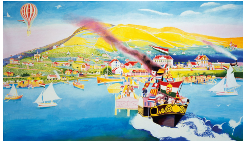
Somogyi Győző: Révfülöp 1900, 2000, 135x230 cm, tojástemperá, vászon