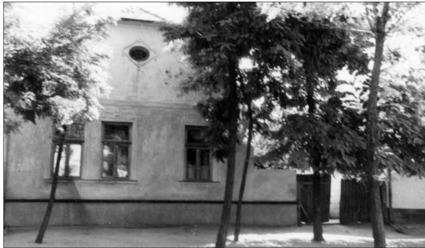
Unser Haus in Waschkut im Jahre 1959

Vielleicht, sinniere ich, kam ihm nun, da er seine Lage klar erkannte, der Gedanke, dass er, vom Schicksal geleitet, an einem Punkt angelangt war, wo ihm noch die Möglichkeit blieb, sich zu entscheiden. Könnte er,