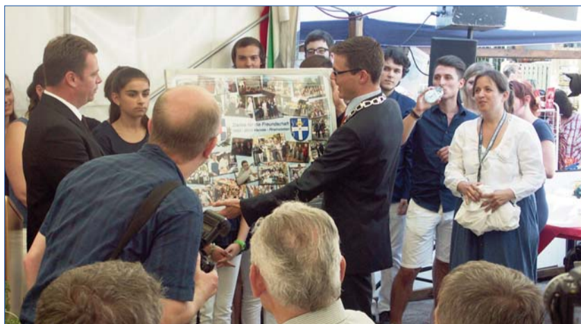
Das Tableau über 20 Jahre Partnerschaft Rheinstetten – Wetschesch

Das zwanzigjährige Bestehen der Partnerschaft zwischen Rheinstetten und Wetschesch/Vecsés kam schon mehrmals zur Sprache. Wetschesch gedachte dieses Jubiläums auf dem Stadtfest. Zum Feiern wählte die Partnerstadt das Forchheimer Dorffest, zu dem nicht nur die Stadt Wetschesch und ihr Kulturverein, sondern auch eine Delegation der französischen Partnerstadt Navarrenx eingeladen wurden. So konnte gemeinsam mit dem zwanzigjährigen Bestehen auch das fünfzigjährige Jubiläum der deutsch-französischen Versöhnung gefeiert werden. Im Jahre 1963 unterschrieben der französische Präsident Charles de Gaulle und der deutsche Bundeskanzler Konrad Adenauer im Élysée-Palast die deutsch-französische Versöhnungsdeklaration. Sie diente allen europäischen Ländern als Beispiel, indem sie zeigt, dass man sogar nach hundertjährigen Feindseligkeiten Frieden schließen kann, wenn es das friedliche Miteinander verlangt.