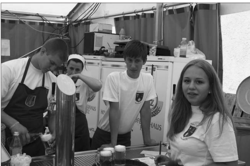
Fleißige junge Wetschescher