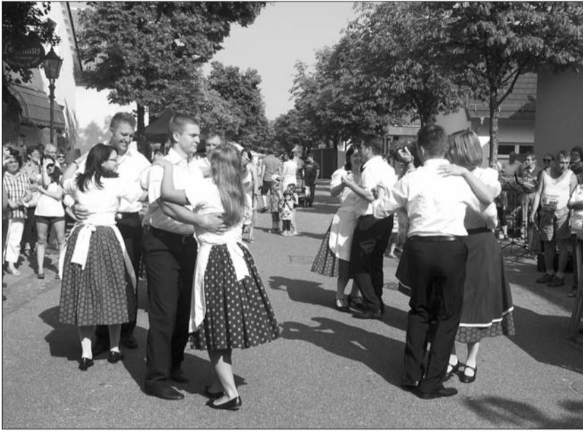
Wetschescher Tänze beim Dorffest in Forchheim