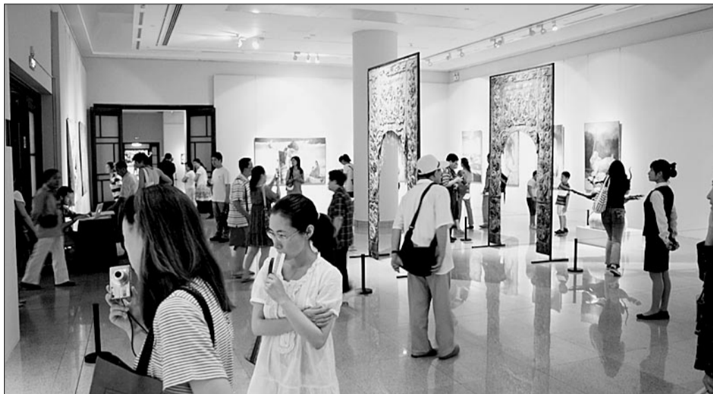
A múzeum egyes termeiben szinte a tűt sem lehetett leejteni, annyi volt az érdeklődő látogató