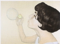
费伦茨·埃泊尔《轻松的下午》，2003，亚克力画。

戴瑞斯·伊斯特瓦是匈牙利艺术学院副院长，他的作品则由印刷版画和柱面镜组成，用柱面镜反射出来画像。这是16世纪发明的艺术。美国、法国也都是他在传播这种技术，现在世界上所有会这门技术的人都是他教的。■