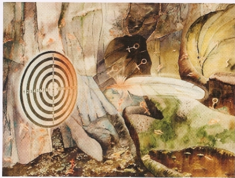
左图：高迪·克里蒙泰斯，《目标》，1995，彩色油画、透明水彩、气枪、漆料、INGOS纸画。/右图：巴卡里·奥比·皮特，《得胜200》，2011，青铜，石。