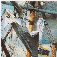
左图：久拉伊·特维莱，《舞娘和提琴手》，2010，彩色铅笔画。/右上图：拉达·曼乃斯《苏非的土地》，2006，布面油画。/右下图：伊姆·阿松什《船长与船》，2009，彩色油画。