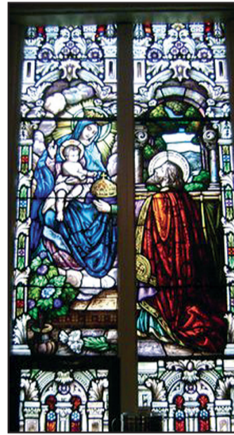
Elárverezik (Szent Lászlót ábrázoló üvegablak egy bezárára ítélt magyar templomból)