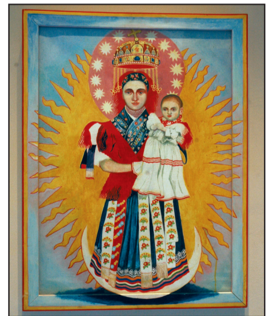
Somogyi Győző: Matyó Madonna