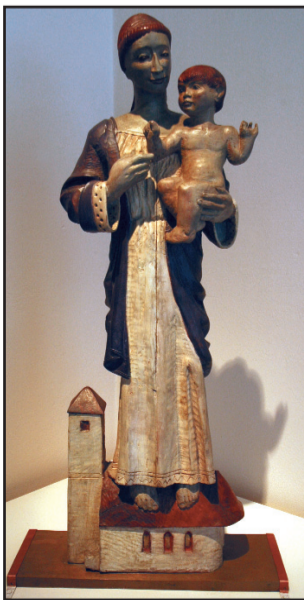
Kő Pál: Látomás

szony-ideálja, míg a hívő katolikusok az Istenszülő tiszteletik személynében.