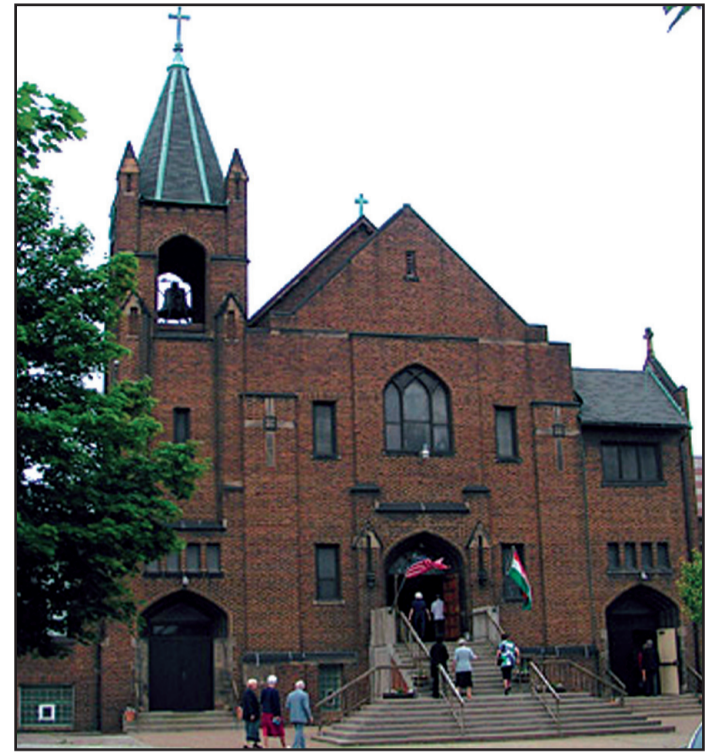
Az egyházközség hívei még reménykednek a kedvező döntésben