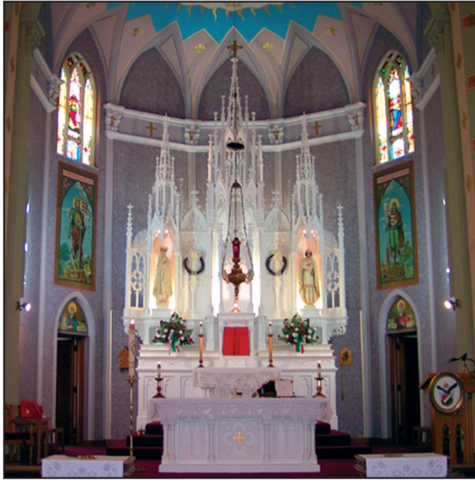
A clevelandi Szent Imre-templom oltára